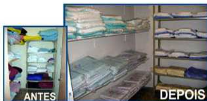
Organização e novos enxovais fazem parte do Roupeiro

Mais uma vez o Projeto Futuro mostra a capacidade de oferecer conforto e respeito aos usuários do Sistema Único de Saúde, com muita organização e dignidade.