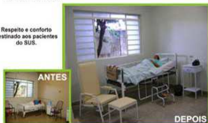
Respeito e conforto destinado aos pacientes do SUS.