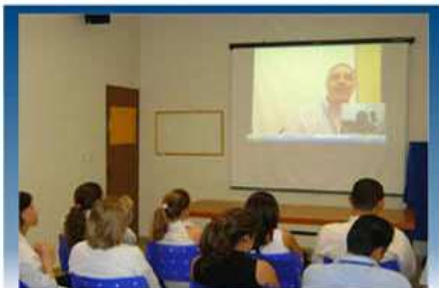
Palestra orienta funcionários sobre o H1N1

O Projeto EDUCASUS, foi desenvolvido pela Federação das Santas Casas e Hospitais Beneficentes do Estado de São Paulo (Fehosp), em parceria com a Secretaria de Estado da Saúde de São Paulo (SES) e a Fundação Arnaldo Vieira Carvalho.