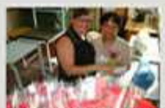
Mães funcionárias homenageadas no Dia das Mães