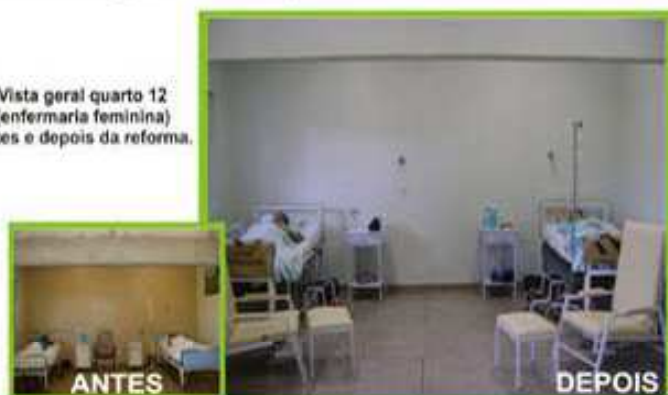
Vista geral quarto 12 (enfermaria feminina) Antes e depois da reforma.