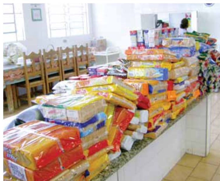
Alimentos arrecadados na 14ª Campanha

Confira abaixo o balanço de todas as campanhas realizadas desde 2009