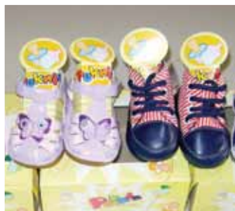
Sapatos Infantis Doados pela empresa Peknin Calçados de Birigui

Peknin Calçados por todas as doações realizadas e por trazer alegria aos pais e bebês que nascem em nosso hospital”.