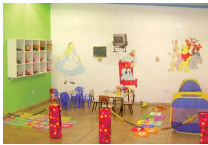
Brinquedoteca Hospitalar da Santa Casa de Buritama