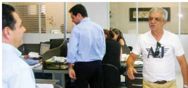
Conheceu também a Ala Administrativa da entidade