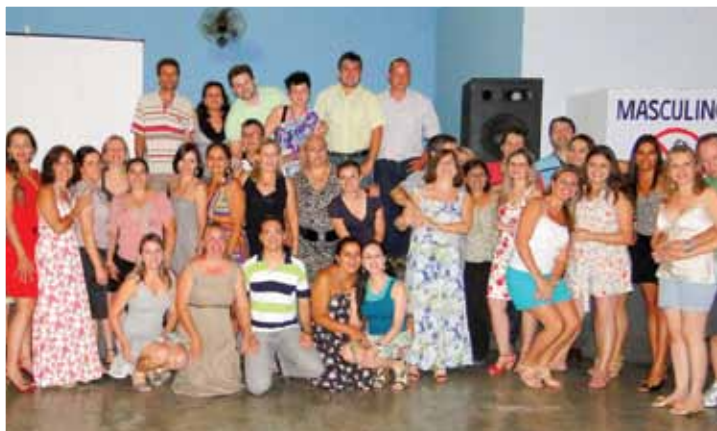
Colaboradores, médicos e voluntários da Santa Casa na 3ª Festa de Confraternização

A Santa Casa de Buritama realizou no dia 02/12, no Salão de Festas Renascer, a 3ª edição do jantar anual de confraternização entre colaboradores, diretoria e voluntários da entidade. O jantar organizado pelo Grupo de Trabalho de Humanização GTH foi uma forma de homenagear os responsáveis por mais um ano de trabalho repleto de empenho e dedicação, além de comemorar o encerramento das atividades de 2011 e brindar um ano novo de muito sucesso e harmonia.