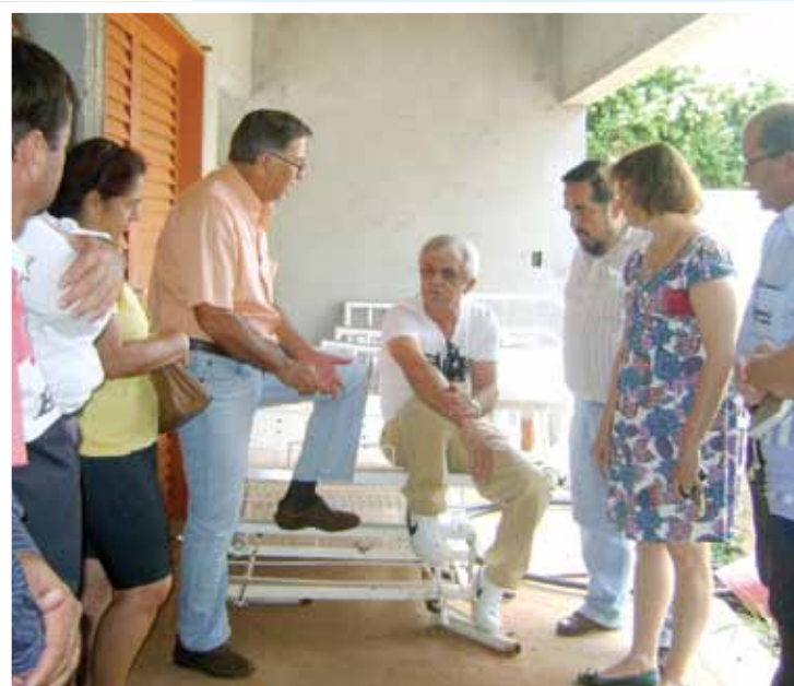
O Deputado esteve presente na Santa Casa para conhecer as obras realizadas com as emendas de sua autoria