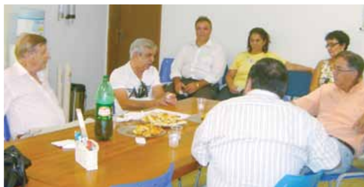
Participou de uma reunião com a Diretoria da Santa Casa

Todos os Diretores da Santa Casa acompanharam os visitantes manifestando profundo agradecimento à ajuda indispensável do Deputado que tem demonstrado grande apreço pela presente administração, sempre colaborando.