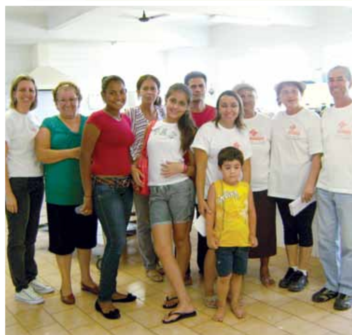
Voluntários que promoveram a 14ª Campanha de Alimentos da Santa Casa