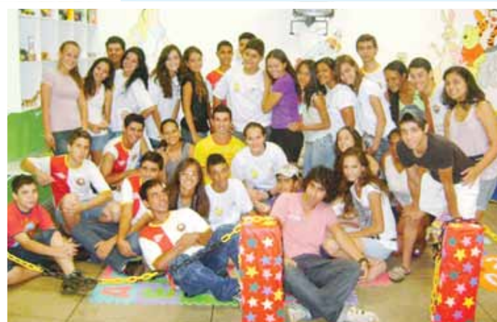
Integrantes do Grupo Sorria