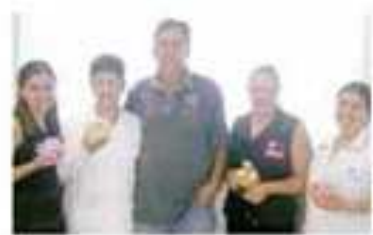
Participantes ganharam kit Mulher