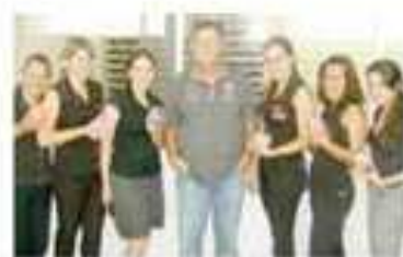
Colaboradoras da administração recebendo o kit mulher