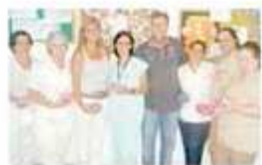
Colaboradoras da cozinha, enfermagem, limpeza e médicas