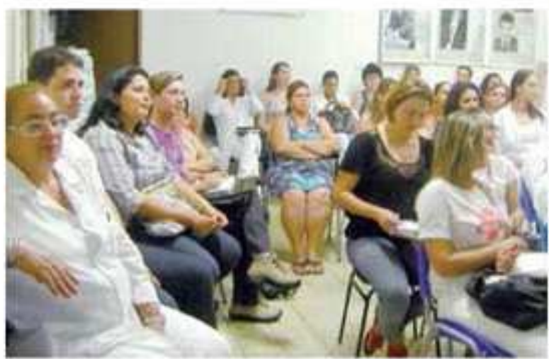
Público presente na palestra da Educação Continuada

Entre os presentes estavam os colaboradores do hospital e funcionários da Secretaria de Saúde das cidades de Lour-