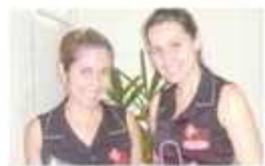
Ganhadoras dos Brindes Sorteados pela Karisma Boutique e Médicos