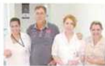
Trabalho de humanização aproxima os colaboradores da entidade