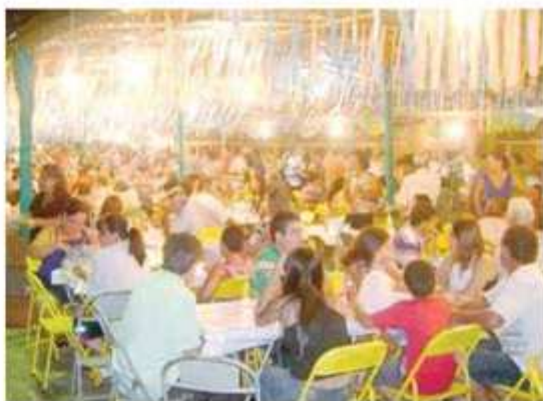
A 6ª Edição da festa superou as expectativas de Sucesso

Como nas edições anteriores, o evento foi realizado na praça da matriz onde também aconteceu o carnaval da cidade