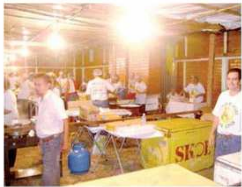
Trabalho voluntário foi grande responsável pelo sucesso da festa.

ZETA OBJETIVO BIRIGUI (18) 3634-2795 BURITAMA (18) 3691-1414 PROMISSÃO