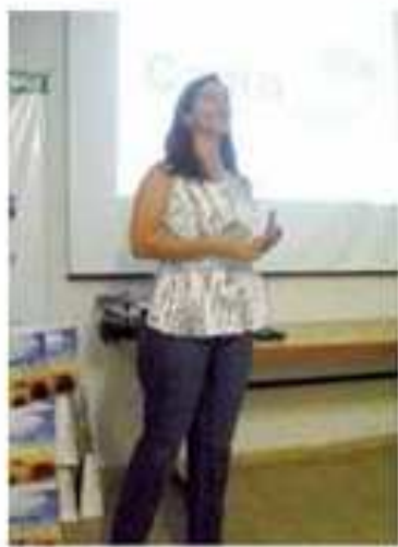
A enfermeira da Capromed