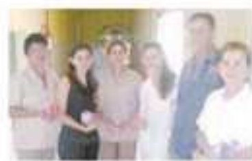
Colaboradoras da farmácia, enfermagem e limpeza recebendo o kit