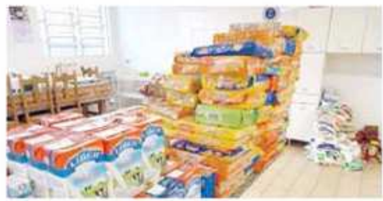
Alimentos Arrecadados na 15ª Campanha