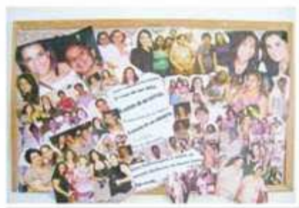
Um mural com fotos de todas as colaboradoras foi exposto em homenagem ao Dia da Mulher na Santa Casa