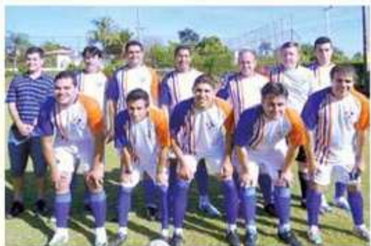
Time campeão do 2º torneio de futebol society, realizado entre hospitais filantrópicos do Estado de São Paulo associados à Fehosp

Com o título, a Santa Casa de Buritama disputará no dia 26 de abril, em Campinas, o campeonato estadual entre os campeões das regionais do estado.